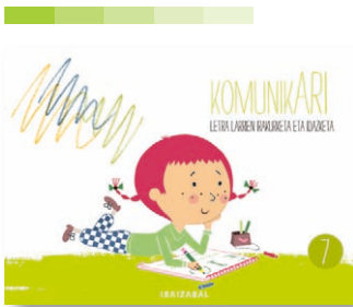
7. koaderno Lehoia eta sagua ipuina.