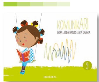
9. koaderno Jon beldurgabea ipuina.