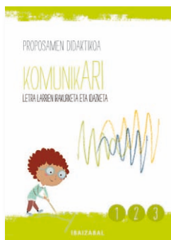
Proposamen didaktikoa. 1., 2. eta 3. koadernoak.

Hiru proposamen didaktiko ditugu. Proposamen didaktiko bakoitzak ikasleen hiru koaderno hartzen ditu barnean, eta fitxetako jardueren programazioak eta iradokizun didaktikoak biltzen ditu bertan.