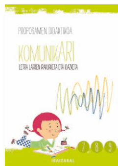
Proposamen didaktikoa. 7., 8. eta 9. koadernoak.

Irakaslearen liburuak honako hau guztia dakar: materialen aurkezpena, proiektuaren planteamendu teorikoa eta inplikazio didaktikoak, edukien taulak, irakaskuntza-ikaskuntzako helburuak, koadernoetako jardueren garapena, eta aurretiko jarduera eta beste jarduera osagarri batzuk. Horiek guztiak honela daude egituratuta :