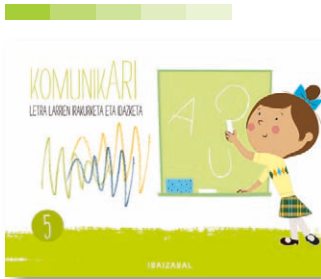
5. koaderno Arratoitxo pinpirina ipuina.