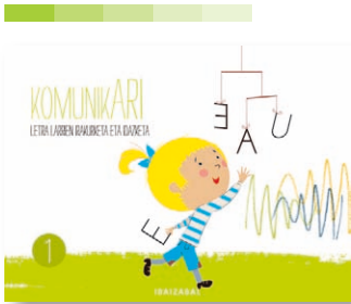
1. koaderno Danbolintxo ipuina.

Bederatzi jarduera koaderno dira guztira, letra larrien irakurketa-idazketa modu progresiboan lantzeko moldatuak. Azkeneko koadernoetan, letra larritik loturako urratsa egingo da. Koaderno bakoitzean ipuin herriko bat dago.