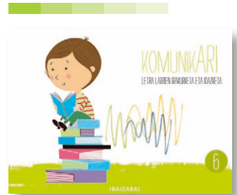
6. koaderno Urre Kizkur ipuina.