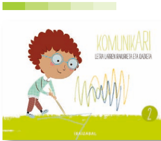
2. koaderno Erpurutxo ipuina.