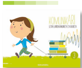
3. koaderno Barraskiloa eta txortalo belarra ipuina.