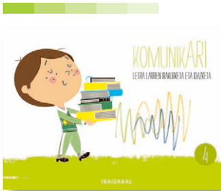
4. koaderno Hiru txerrikumeak ipuina.