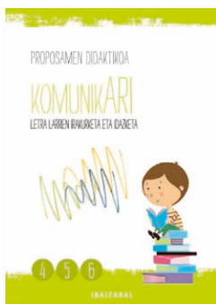
Proposamen didaktikoa. 4., 5. eta 6. koadernoak.