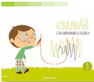
8. koaderno Jack eta ilar magikoak ipuina.