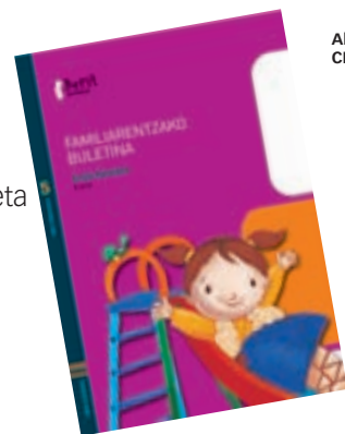
Abestien eta ipuinen CDa